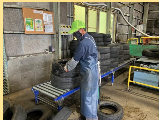
③ローラーコンベヤーにセット