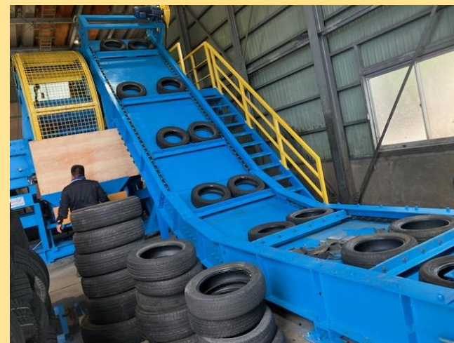
③コンベアーに投入