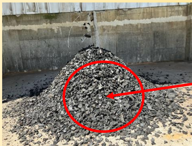
⑤タイヤチップ (2インチ品)